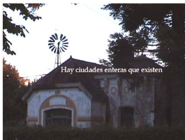
Mara Facchin. Ocho casas perfectamente iguales . 2003.

Si pensamos en la geografía como ciencia, no podemos dejar de suponer una cierta estabilidad del mundo. Una espacialidad de naciones y fronteras, ciudades y rutas, centros y periferias, sólo puede sustentarse sobre un territorio de propiedades constantes, o a lo sumo, sobre uno regido por el reloj de la naturaleza, con procesos de cambio lentos e imperceptibles.