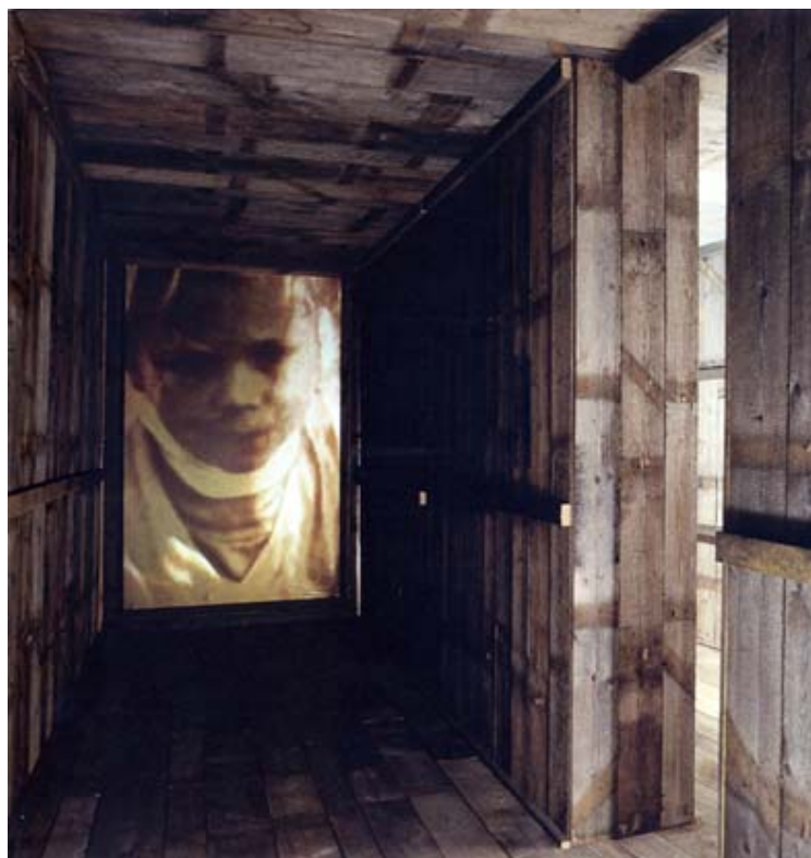
El Reformatorio (versión instalación). 1992.

Un perro que como el del mencionado film reaparece de manera constante en toda su obra ("un perro es espejo" sentencia el adulto de El Reformatorio ) es testigo incólume del despliegue audiovisual. Figura cotidiana y sugerente a la vez, parece insinuarnos que en la obra de Infante, como en la vida, no hay exigencia mayor que la de transcurrir atentos.