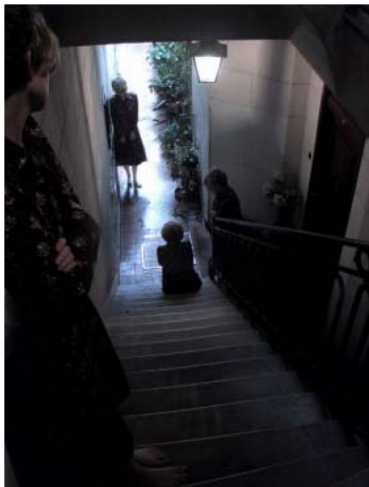
FLAVIA DA RIN Sin título Fotografía, 100 x 73 cm

menes, texturas, materialidades, peso, equilibrio. Pero al mismo tiempo coexisten otros valores casi existenciales, como la fragilidad, la transitoriedad, la presencia o el poder de lo aparentemente insignificante. Curiosamente, cuando el arte está en condiciones de ofrecer elevados niveles de complejidad, habida cuenta de su extensa y nutrida historia, los artistas contemporáneos prefieren la sencillez y los lenguajes familiares. En esa opción se pone de manifiesto su interés por trascender los ámbitos especializados para llegar a un público más amplio. En medios actuales o tradicionales, con procedimientos inusuales o históricos, pero siempre con una mirada contemporánea y atenta al entorno, los jóvenes creadores argentinos hacen su aporte a un circuito que intenta reactivar el diálogo con la gente, que necesita renovar propuestas y reformular miradas, y que busca en la producción emergente la chispa de frescura y originalidad que alimente la (eterna) juventud del arte. •