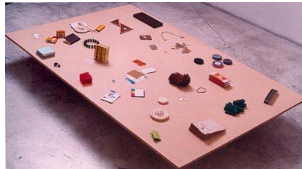
DANIEL JOGLAR obra técnica, 160 x 120 cm

En la realización de sus obras, suele utilizar los programas destinados al dibujo arquitectónico, ideales para el trazado de líneas geométricas y la construcción de perspectivas, pero fatales a la hora de diseñar objetos no previstos en sus funciones. Y el artista, justamente, se empeña en llevarle la contra al programa, haciéndolo dibujar múltiples curvas y arabescos. El “efecto serrucho” que se observa en las líneas curvas de muchas de sus piezas es la consecuencia,