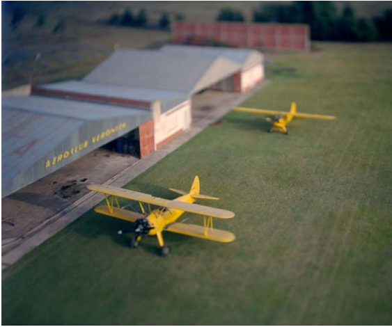
Esteban Pastorino. Aeroclub Verónica . 2003.