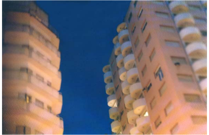
Ignacio Iasparra. De la Serie Paisajes . 2002.

Las fotografías son, en definitiva, el resultado de una toma directa; sin embargo, se ha desplazado de ésta el sentido de instantaneidad que habitualmente identificamos con tal procedimiento. Ese desplazamiento corresponde, en realidad, a un corrimiento del propio trabajo fotográfico hacia el instante de la selección. Sabemos que todo fotógrafo selecciona sus imágenes, pero el fotógrafo tradicional lo hace después de haberlas construido. Pastorino se encuentra con las imágenes tomadas por el dispositivo, y es en la selección de las copias donde configura su mirada, donde confirma o no el encuadre, la nitidez, la luminosidad, el ángulo o las demás variables del registro. De esta forma, es en la selección, y no en la toma, donde se realiza el acto fotográfico.