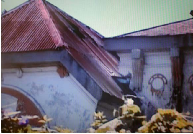
Mara Facchin. Ocho Casas Perfectamente Iguales . 2003.