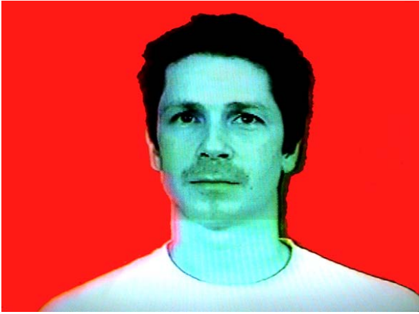
Inés Szigety. Palabras em Blanco . 2004.