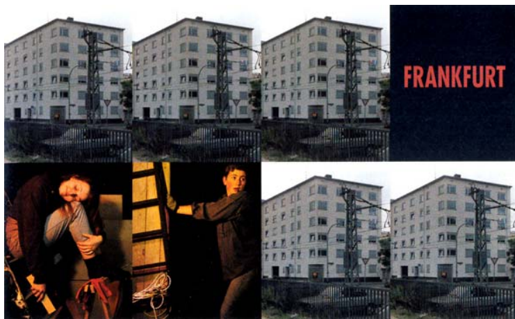
Suzanne Lafont. Trauerspiel . 1997