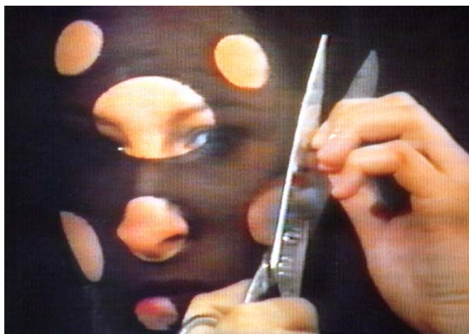
Sanja Ivekovic. Personal Cuts . 1982.

Las obras oscilaron entre miradas extremadamente personales y reflexiones críticas sobre situaciones históricas, sociopolíticas, económicas y culturales, de la mano de artistas comprometidos políticamente o encauzados en un análisis de su entorno. Primaron las instalaciones y el uso de medios documentales, como la fotografía y el video. El origen diverso de los artistas seleccionados obligaba a un esfuerzo constante por entender el contexto en el que cada uno de ellos había producido sus obras, ya que muchas de éstas sólo adquirirían sentido en relación con su lugar de origen (algunas de las obras participantes fueron analizadas en el artículo El Arte Contemporáneo en el Cambio de Milenio ).