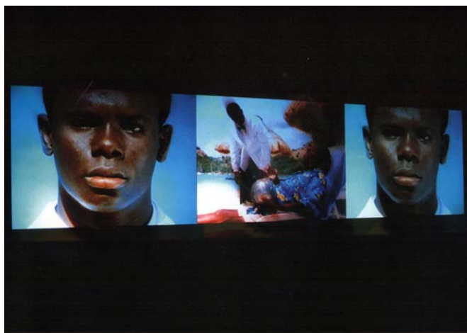
Isaac Julien. Paradise Omeros . 2002.